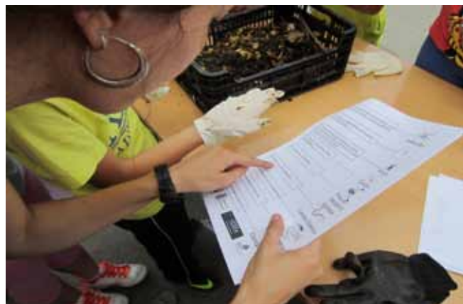
Taller "Explorador del Compost", realizado en el municipio de Alhendín con alumnos de 5º de Primaria