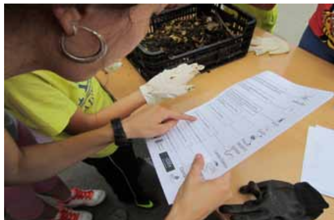
Taller "Explorador del Compost", realizado en el municipio de Alhendín con alumnos de 5º de Primaria