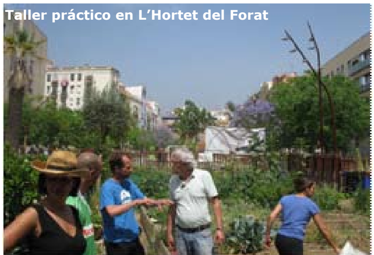
Taller práctico en L'Hortet del Forat

Gracias a la dinamización y a los talleres prácticos en materia de compostaje los usuarios se empoderaron y poco a poco la figura del dinamizador-tallerista fue desapareciendo. Para comprobar la viabilidad del compost y del proceso se realizaron unos análisis químicos de laboratorio. Estos determinaron que el compost obtenido tuvo unos niveles bajos en metales pesados y que equivalía a la categoría "Compost A" según la legislación vigente, pudiéndose utilizar en agricultura ecológica.