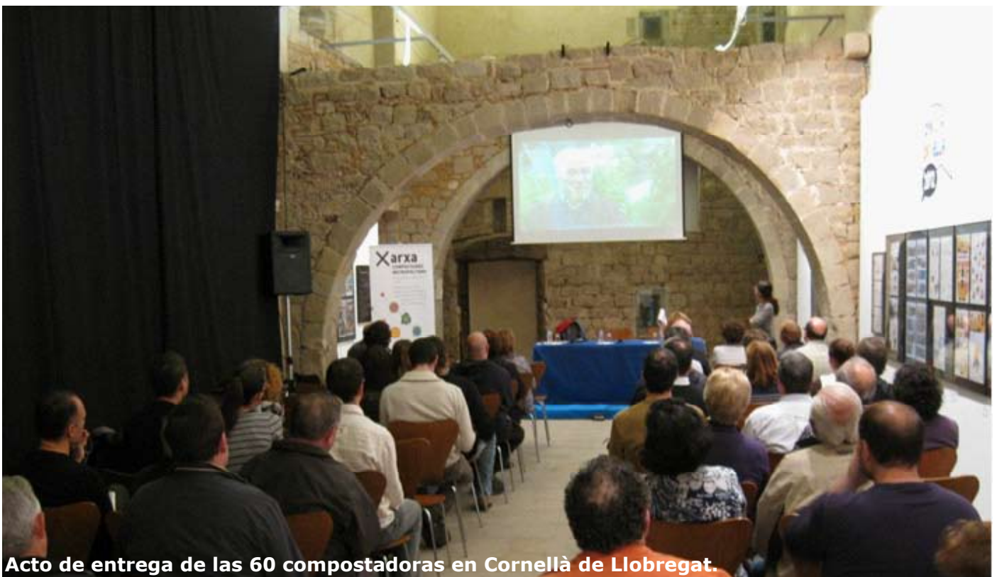
Acto de entrega de las 60 compostadoras en Cornellà de Llobregat.

Los nuevos usuarios asistieron a una sesión de formación sobre compostaje que tuvo lugar el 22 de noviembre en el Castell de Cornellà.