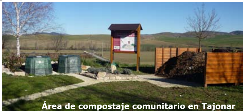
Área de compostaje comunitario en Tajonar

A lo largo de 2012 se han incorporado 3 nuevos municipios al compostaje comunitario: Tajonar, Añorbe y