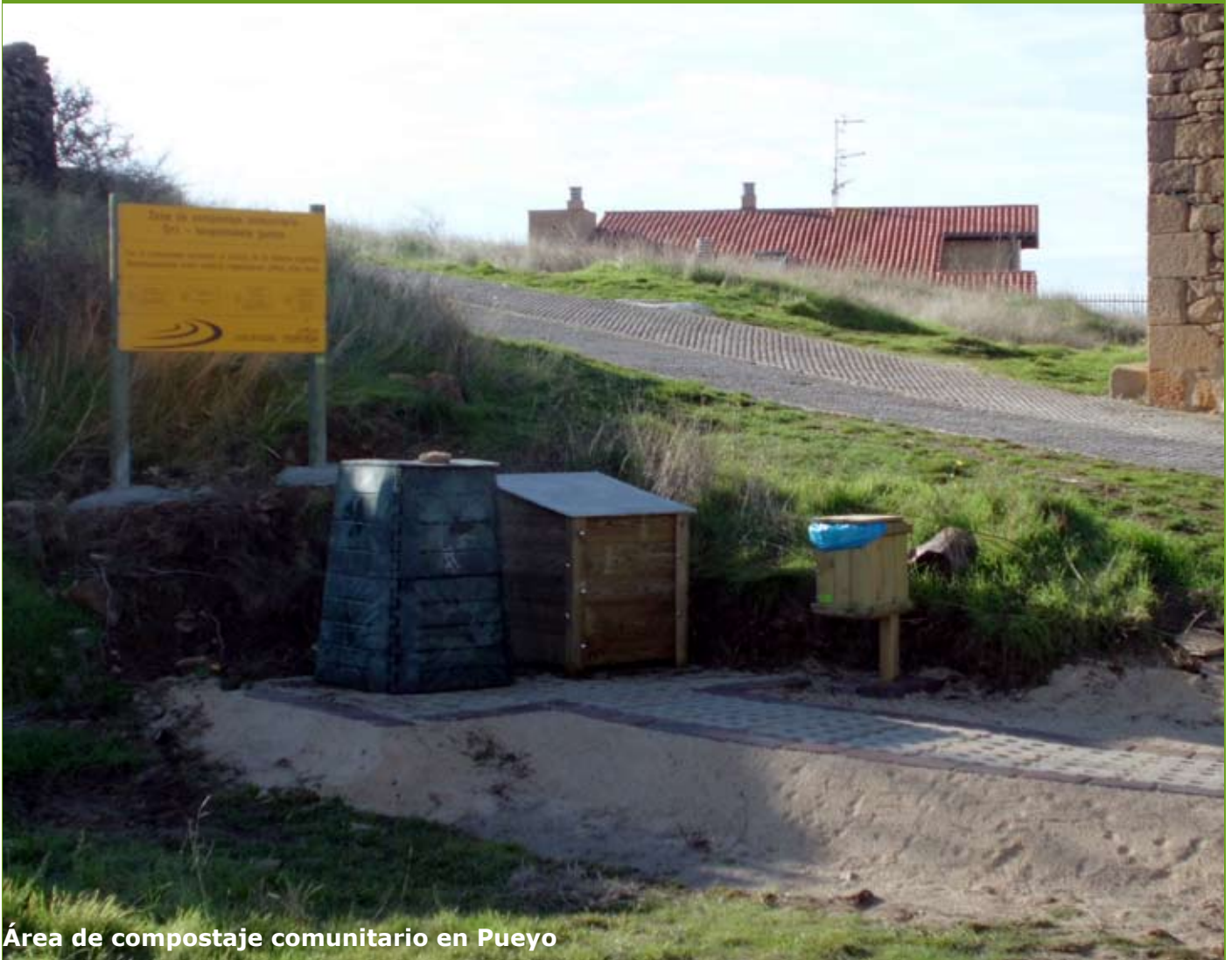
Área de compostaje comunitario en Pueyo

- Análisis de las características técnicas y sociales asociadas a procesos de compostaje comunitario. Estudio de caso en el huerto urbano comunitario L'Hortet del Forat.