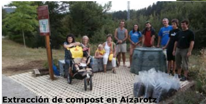
Extracción de compost en Aizarotz