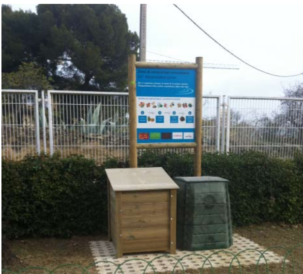
Área de compostaje en el patio de la ikastola Garcés de los Fayos (Tafalla)

A través de estos proyectos, la Mancomunidad de Mairaga quiere reducir la cantidad de residuos orgánicos producidos en nuestros hogares que posteriormente se trasladan a las plantas de tratamiento de residuos.