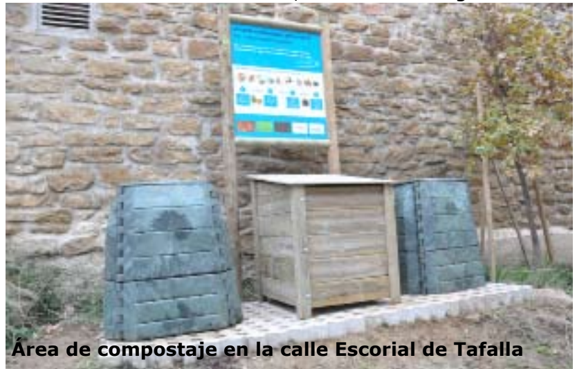
Área de compostaje en la calle Escorial de Tafalla

En el barrio Irigoien de Pueyo y en la calle Escorial de Tafalla ya se viene funcionando desde hace dos años con este tipo de compostadores. Sin embargo, el ubicado en la ikastola de Tafalla, es una experiencia piloto que tiene como objetivo la realización de compostaje con los restos de frutas del almuerzo del alumnado del ciclo de infantil. El profesorado del centro será el encargado de informar a los pequeños y trasladar los residuos al área.